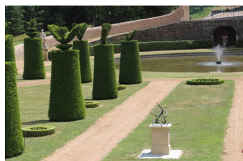
Le cadran dans l'alignement de la fontaine