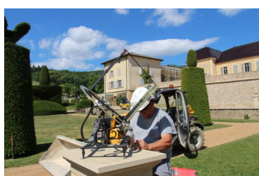
Orientation et scellement du cadran