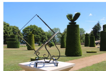
Le cadran posé