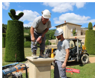
Perçage des trous de fixation

(réalisée par l'équipe de maçons en charge de la restauration du château)