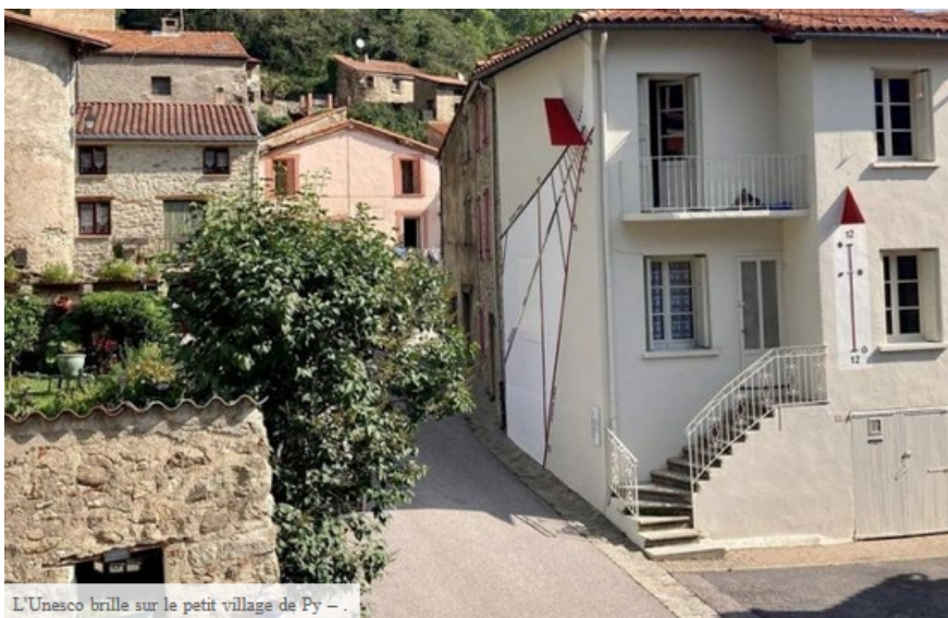
L'Unesco brille sur le petit village de Py -

A lire aussi : Pyrénées-Orientales : l'artiste Marc-André 2 Figières sculpte une résurrection moderne de son cadran solaire monumental dans le petit village de Py ... ».