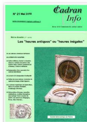
CI n° 21