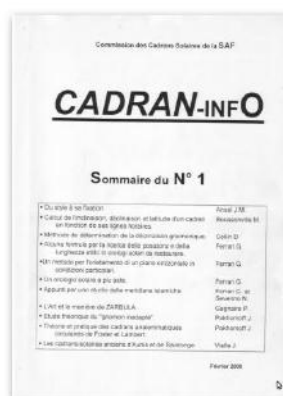
CI n° 1