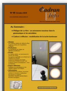
CI n° 40